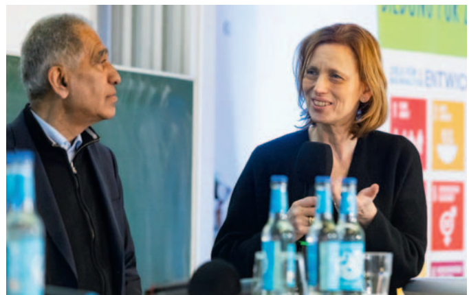
Prof. Mojib Latif und Ministerin Karin Prien im Gespräch

Das Themenspektrum war vielfältig und reichte von „News oder Fake News, woran erkennt man Wahrheit?“ und „Intelligente Landmaschinen für die Landwirtschaft der Zukunft“ oder „Abwassereinigung durch Mikroalgen – Forschung für Nachhaltigkeit“ bis zu „Wolle statt Mikrofasern“ und „Lärm unter Wasser, Gefahr für Wale und Delfine“. Die Jugendlichen erhielten nicht nur Einblick in die zukünftigen Veränderungen der Ostsee, sie konnten in praktischen Versuchen aktiv werden und untersuchen, welche Folgen die Mülleinträge in den maritimen Lebensraum haben oder in Teams und mithilfe von Tablets und Handys die Umgebung des Hörsaals erforschen und herausfinden, wie man den ökologischen Fußabdruck verringern kann.