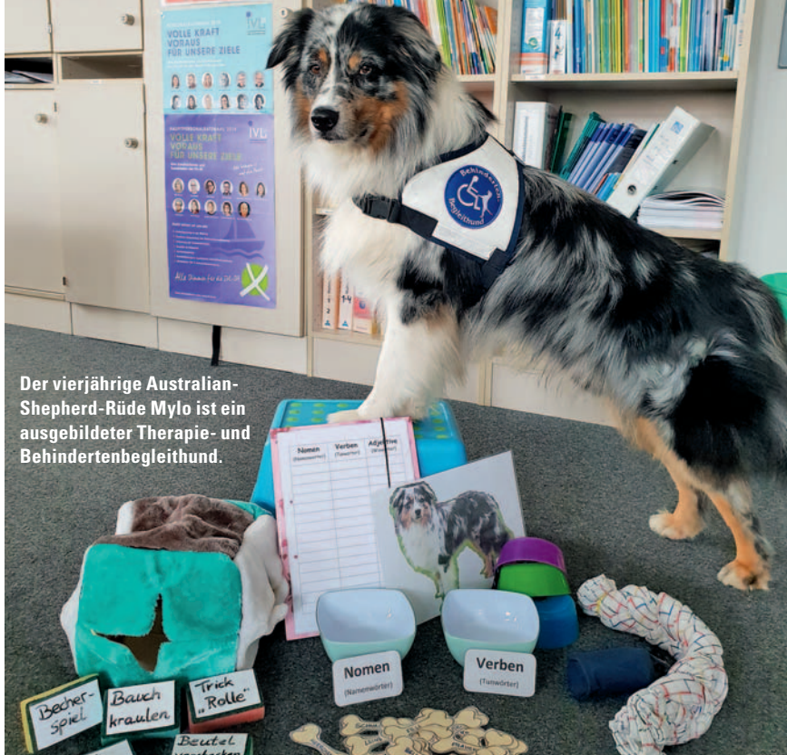
Der vierjährige Australian-Shepherd-Rüde Mylo ist ein ausgebildeter Therapie- und Behindertenbegleithund.