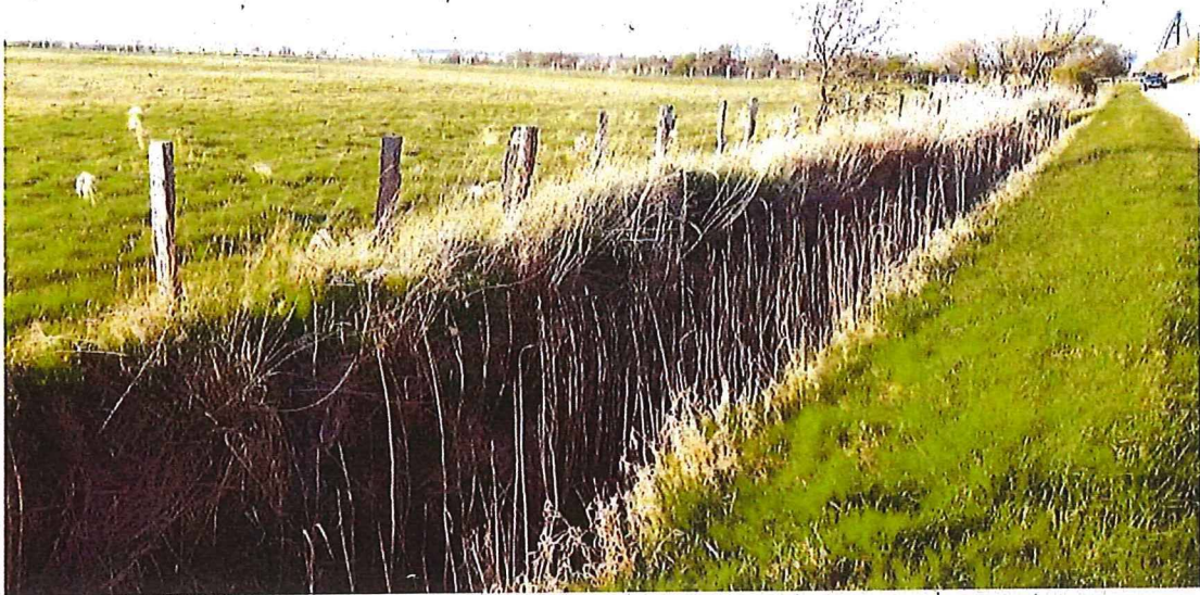
4 Ausgleichsfläche rechts