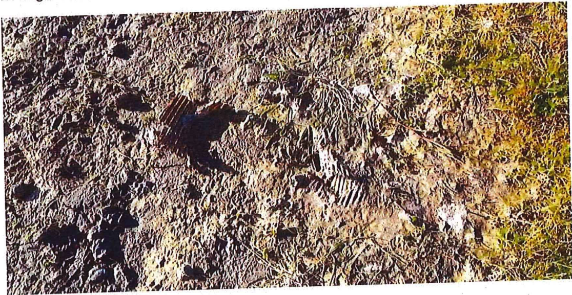
3 Reste einer Drainage